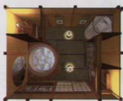
Площадь 20 м 2

Освещение тоже выполнено по упрощенной традиционной системе — 2–3 замаскированных светильника, которые дают только засветку на стены. Кроме них используются два дополнительных переносных, выполненных в виде старинных японских фонарей из бамбука и бумаги. Возможность установить в них обычные свечи, создав тем самым интимное освещение, является несомненным преимуществом.