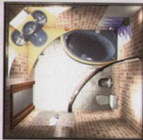
Площадь 9 м 2

Локальный свет в ванной комнате освещает отдельные зоны — столик с умывальником, полочки за ванной и санузел за перегородкой. Причем, в целях экономии, проектом предусмотрена возможность включения/отключения той или иной световой точки.